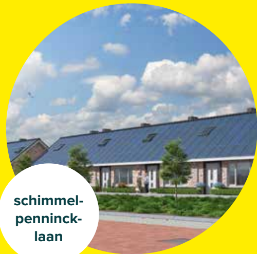
schimmel- penninck- laan

Zo versterken we de bestaande groenstructuur en ontstaat er ruimte voor een kindvriendelijke zone. Daarnaast gebruiken we de lage ligging van de Schimmelpennincklaan. De groenzone kan zo op een natuurlijke wijze regenwater opvangen.