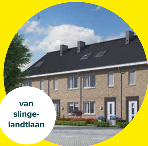
van slinge- landtlaan